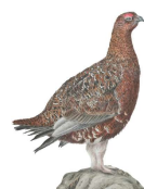
mithko pithTW misko pithTW